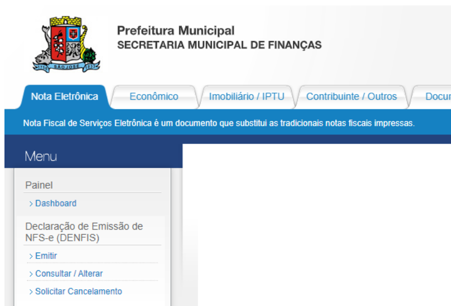
02. Menu de opções – Tela Principal

Após acessar o sistema com seu usuário e senha, aparecerá a tela principal (Dashboard) com algumas informações. No menu esquerdo Nota Fiscal de Serviços , clique na opção emitir .